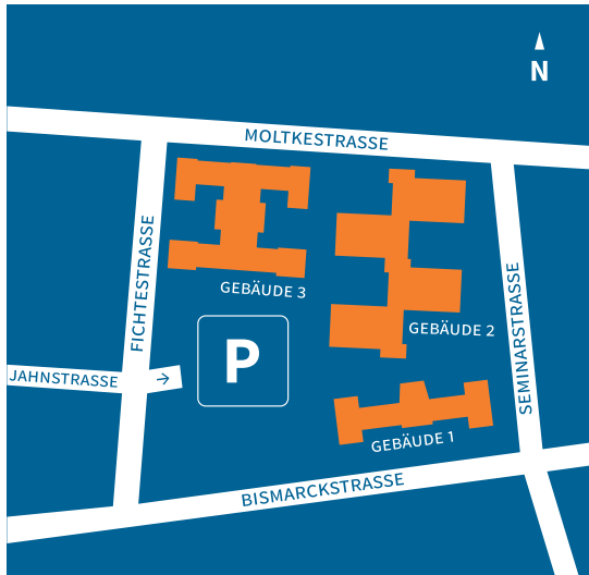
A Pädagogische Hochschule