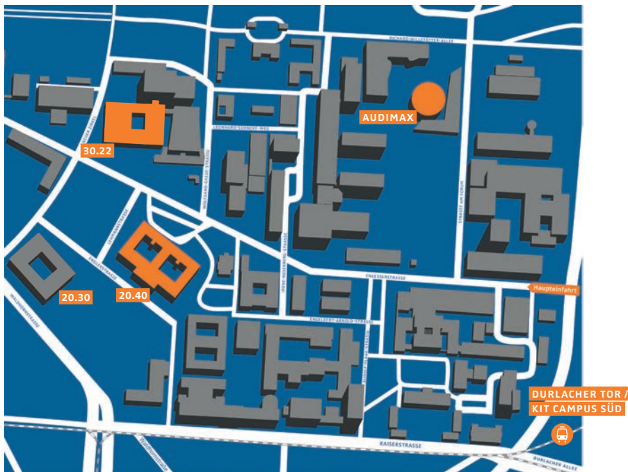
B KIT, Campus Süd