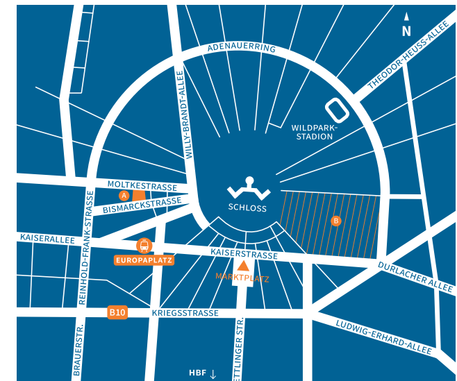
A Pädagogische Hochschule B KIT, Campus Süd